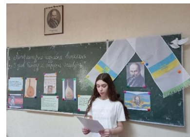
Матеріал із сайту Ужгородського наукового ліцею https://school.uz.ua/news.html